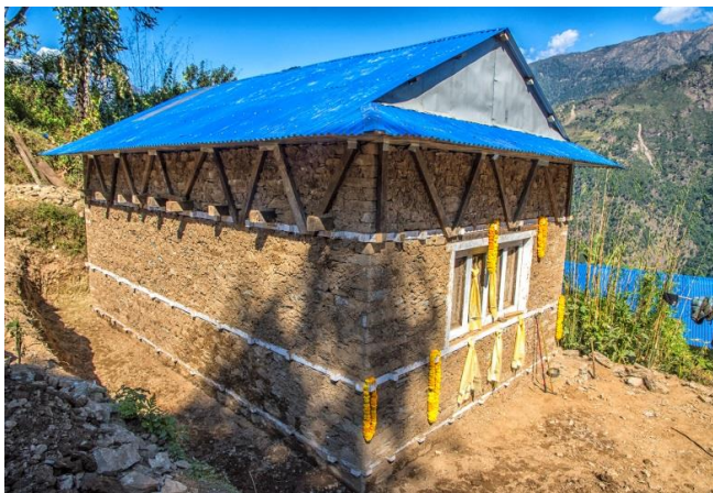
Maison parasismique reconstruite en novembre 2017

ANUVAM poursuit également son action de prévention en matière de santé en finançant à hauteur de 60 € pour les familles volontaires la construction d'un foyer de cuisine extérieur pour éviter les problèmes pulmonaires très nocifs.