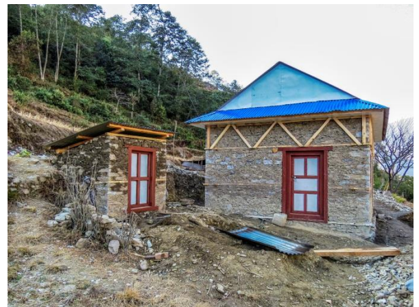
Maison et toilettes parasismiques construites en décembre 2018

Durant l'hiver 2018-2019 trois autres maisons ont été construites, avec l'aide des maîtres d'œuvre népalais, pour des familles qui jusque-là vivaient dans des cabanes. ANUVAM a fourni une aide financière de 6000 € par maison faute de matériaux à récupérer sur place.