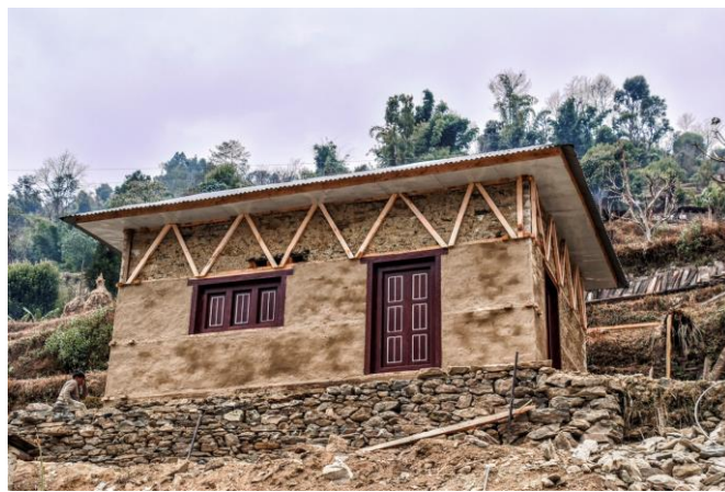
Maison de Nau Maya construite en février 2020

Durant les hivers 2018-19 et 2019-20 six autres maisons ont été construites, avec l'aide des maîtres d'œuvre népalais, pour des familles qui jusque-là vivaient dans des cabanes. ANUVAM a fourni une aide financière de 6000 € par maison en partenariat avec l'association CDC développement solidaire iii qui apporte une contribution aux dernières constructions.