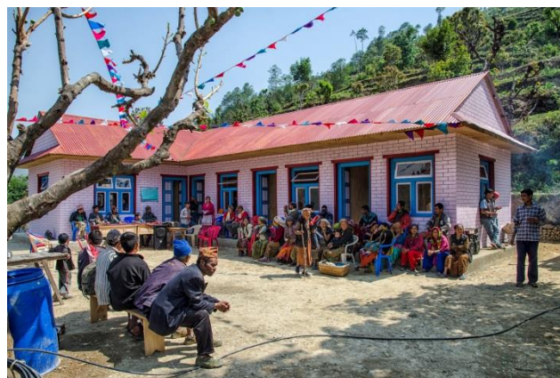
Inauguration du dispensaire (mai 2013)

ANUVAM a réussi à faire construire un pont au-dessus de la rivière pour désenclaver le village. A ces réalisations concrètes s'ajoutent un volet culturel, des publications sur les traditions de l'ethnie Khaling Rai et l'organisation de trekkings solidaires ii .