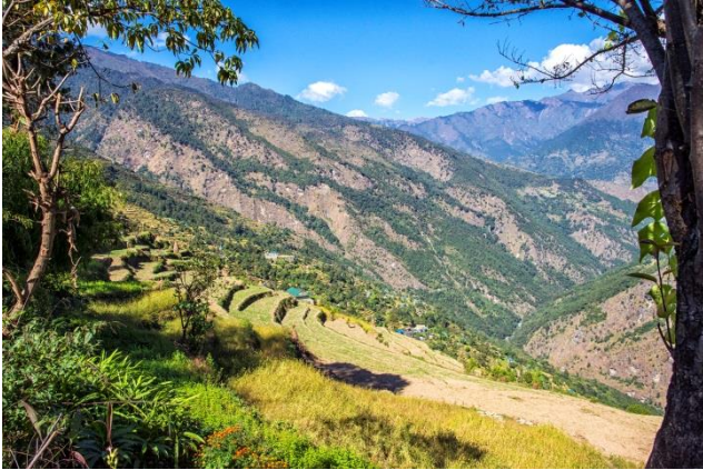
Cultures en terrasses près de Rapcha au-dessus de la Dudh Khosi

Depuis seulement la fin 2017, le village est accessible par une piste en jeep. Jusqu'à présent, le petit aéroport de Phaplu était à 2 jours de marche et le dernier point d'accès par la route à 7 jours.