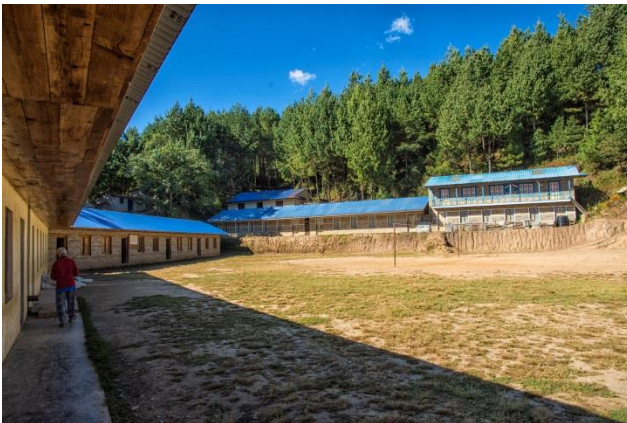
Ecole secondaire de Basakhali (novembre 2017)

Le village a connu d'autres évolutions importantes dans le domaine de l'éducation et de la santé avec l'apport de notre association qui a participé à la construction d'écoles et à la mise en place d'un dispensaire .