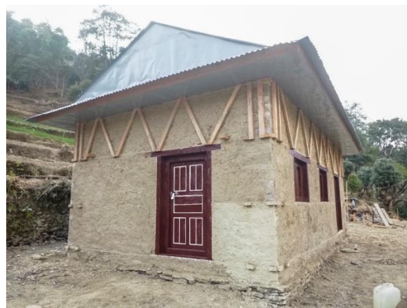
Maison parasismique construite en décembre 2020

Durant les hivers 2018-19, 2019-20 et 2020-21 huit autres maisons ont été construites, avec l'aide des maîtres d'œuvre népalais, pour des familles qui jusque-là vivaient dans des cabanes. ANUVAM a fourni une aide financière de 6000 € par maison en partenariat avec l'association CDC développement solidaire ii qui a apporté une contribution aux dernières constructions.