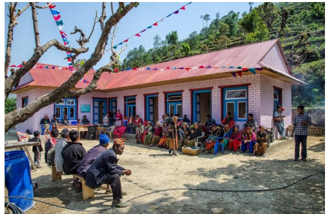
Inauguration du dispensaire (mai 2013)

ANUVAM a réussi à faire construire un pont au-dessus de la rivière pour désenclaver le village. A ces réalisations concrètes s'ajoutent un volet culturel, des publications sur les traditions de l'ethnie Khaling Rai et l'organisation de trekkings solidaires.