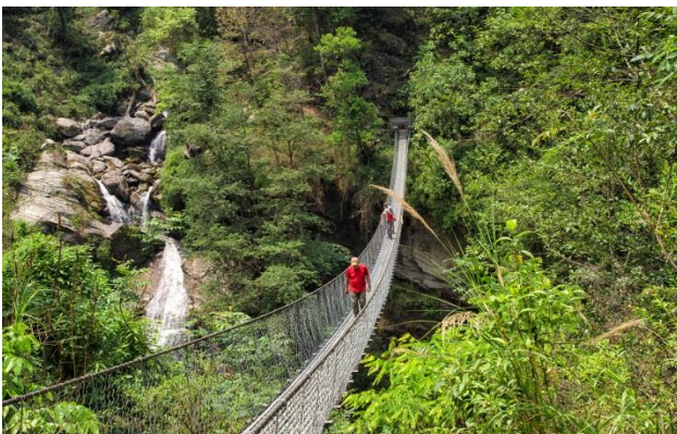
Le pont métallique construit en 2009

ANUVAM a réussi à faire construire un pont au-dessus de la rivière pour désenclaver le village. A ces réalisations concrètes s'ajoutent un volet culturel, des publications sur les traditions de l'ethnie Khaling Rai et l'organisation de trekkings solidaires.