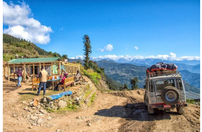
Descente vers Rapcha par la nouvelle piste

Le village a connu d'autres évolutions importantes dans le domaine de l'éducation et de la santé avec l'apport de notre association qui a participé à la construction d'écoles et à la mise en place d'un dispensaire .